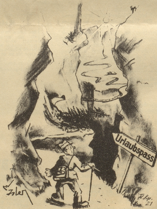
Ein mühseliger Pass