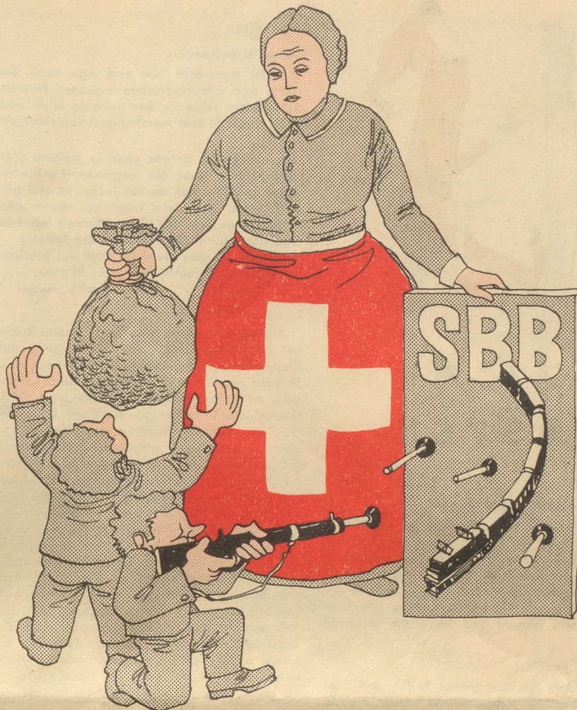
Das Schwyzvork hatte am 21. Januar auch über die Sanierung seiner Südostbahn abzustimmen, die nur mit der vom Bund gewährten Privatbahnhilfe möglich ist. Die Ostbahnvorlage wurde angenommen, das Bundesbahngesetz bachab geschickt.