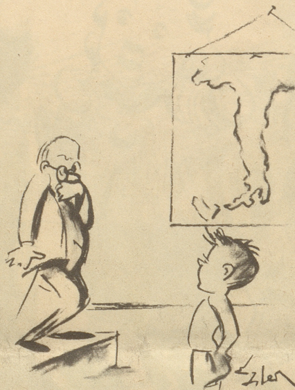
«Was fällt Dir uf Hansli a dr Charte vo Italie?» «s' vergesse Bei vom Mussolini!»

Also, die bezahlten, unbezahlten und halbbezahlten Autos werden auf unsern Straßen ein gewaltiges Regiment errichten. In den Städten wird man in