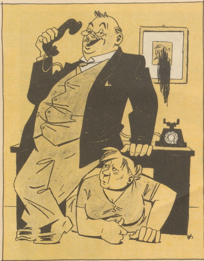
„Ha Di etz emal verwütscht? Etz säg mr wa häsch Du mit dere Ipsophon?“