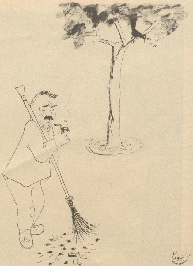
„Isch ächt de Tschörtschill scho choo?“