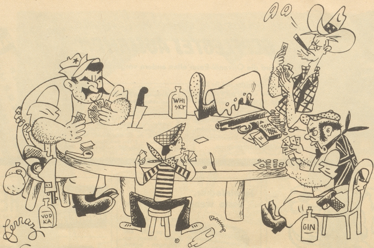
Man verleugnet die gute Kinderstube!