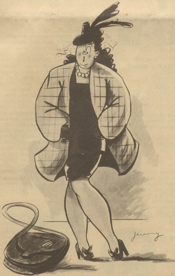
Lige laa oder de Schüpp verschpränge, das ist hier die Frage!