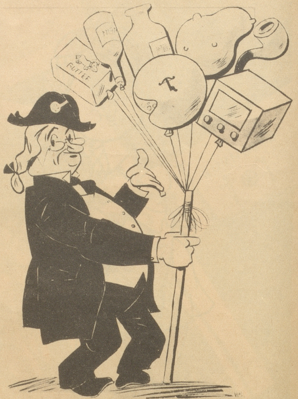
Milch - Käse - Butter - Kartoffel - Tabak - usw. - Preise steigen.