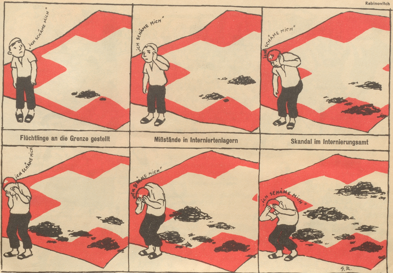
Prominente Nazis im Lande geduldet