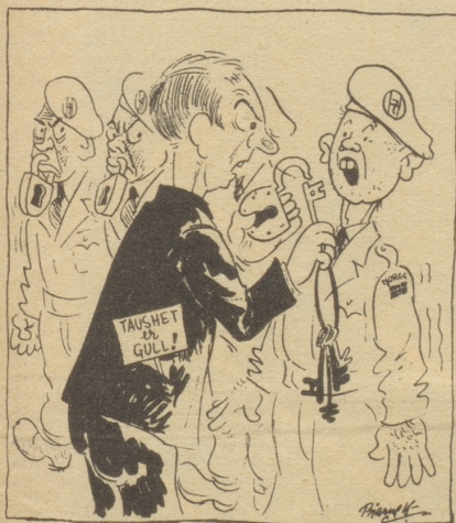
In Norwegen verabreicht man den Heilgenossen eine Medaille! Tyrhans, Oslo