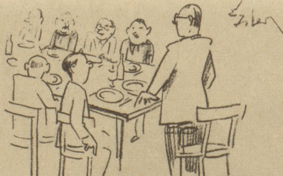
«Mein Tischnachbar wird nach dem Bankett eine freiwillige Tellersammlung durchführen zugunsten des Servierpersonals!»

in die kriegsgeschädigten Gebiete zu tragen. Haben wir bis dahin Liebesgaben abgeschickt, so wollen wir nun auch eine geistige Nahrung spenden. Und wie hungrig ist man überall danach. Dabei werden sich die schweizerischen Gesellschaften, die in jene Städte mit den Spuren des Elends reisen, davor hüten, sich ähnlich oder gar gleich zu benehmen, wie gewisse Kegelklubs und Gesangvereine nach dem ersten Weltkrieg, die sich in den Kriegstaaten so benehmen, als wäre Kinderstube in der Schweiz eine Rarität. Damals ist es vorgekommen, daß die Reisenden mit ihrem Geld um sich geworfen, Velos damit beklebt und vor den hohlen Augen Hungeriger geschlampamt und gevöllert haben. Das darf nicht mehr vorkommen. Es ist zwar anzunehmen, daß die Ruinen dafür sorgen werden, daß den reisenden Helvetern das Protzen und die Allotria vergeht. Man weiß aber, wie sehr gerade Leute, die reiseungewohnt sind, sobald sie die Luft der Fremde um sich spüren, alle Fassung, alle Würde und allen Takt verlieren. Leute, die in ihrer Heimat die Biederkeit selber sind, werden in fremden Ländern zu moralischen Anarchisten. Behüte uns Gott davor, daß unsere Reisegesellschaften nicht mehr in jene Barbarei zurückfallen. Es wird gut sein, wenn wir schon jetzt diese Dinge besprechen.