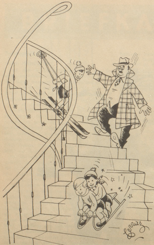
Wänn de Schnee Verschpöötig hät