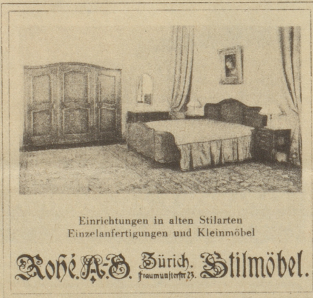
Einrichtungen in alten Stilarten Einzelanfertigungen und Kleinföbel

Rose A. S. Zürich. Stilmöbel. Fraumunsterstr. 23.