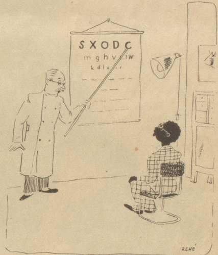
«Eine Schlange, ein Kreuz, eine Kugel, ein Bogen, ein Haken ...» Söndagsnisse-Strix