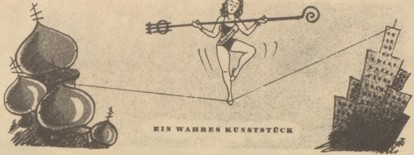
EIN WAHRES KUNSTSTÜCK