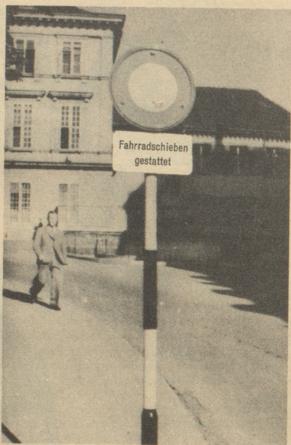
Großzügigkeit ist eine Zier, der Basler treibt Exzeß mit ihr! Ein Zürcher.