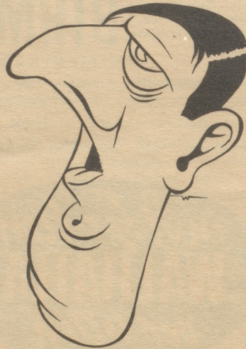
Zeitgenosse: De Gaulle