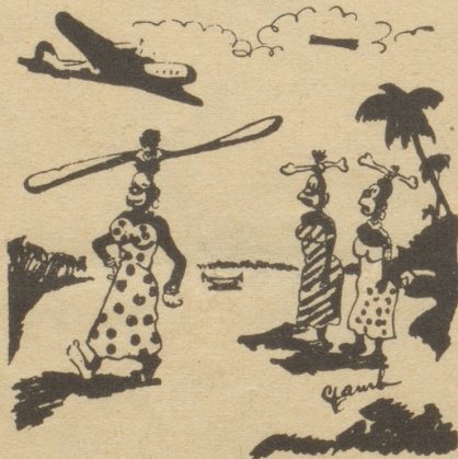
Die Wohltat der Zivilisation. Esquire