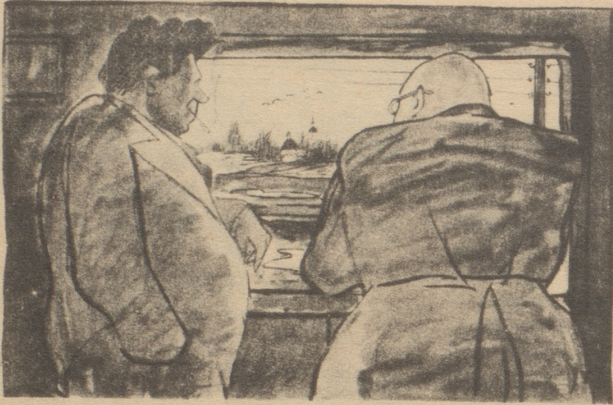
Mensch und Natur