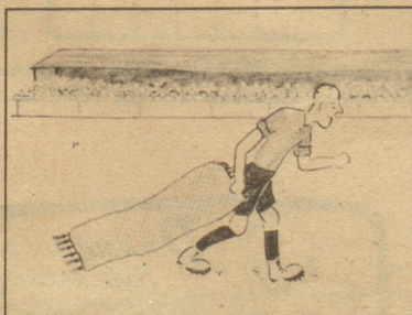
Wenk zieht mit einer Vorlage davon