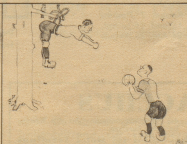
Oberer gibt an Sutter, der weit vorne hängt