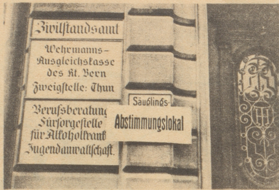
Thun, im Jahrhundert des Kindes