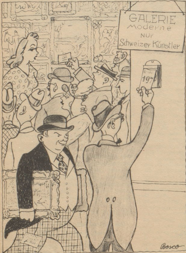
In den Kunsthandlungen: „Dra-cho-Nümmerli“