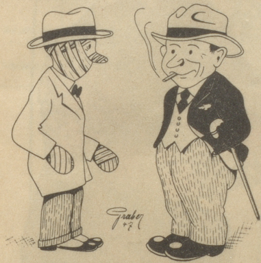
«Unfall gha?» «Nei, s' Rauche-n-abgwöhnel»

Der politische Salat ist nicht damit gemeint, sondern eine ebenso gluschtige wie farbenfreudige Salatplatte aus Tomaten, Gurkenscheiben, Scheiben von neuen Zwiebeln, und Peterli. Fein! Etwas für Kenner und die es werden wollen. «Es sieht aus, wie ein blümeltes Kleid», meint das Teresli und der Fritz sagt: «'s gliicht em Teppichmuschter!» Die Jugend hat Phantasie. — Orientteppiche von Vidal an der Bahnhofstraße in Zürich.