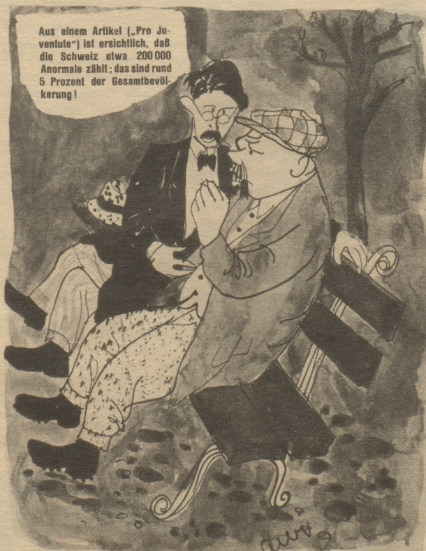
„Sinzi unbesorgt Herr Nachbar, solang s' nid d'Mehrheit händ chönd die nüt usrichte!“