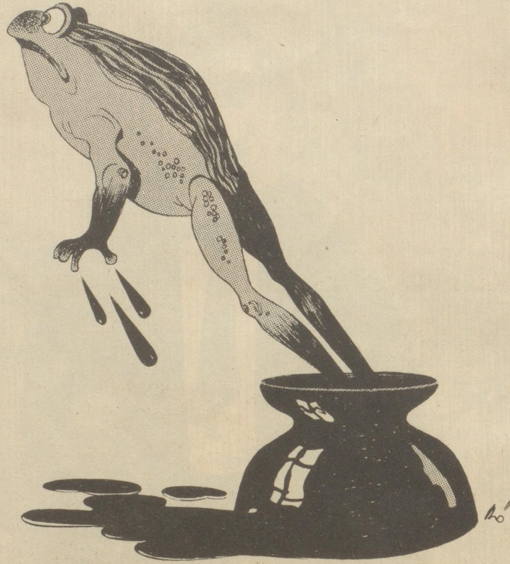
Zu den Schwarzmalereien der Weltpresse über neuaufziehende Kriegswolken

Laßt uns doch nicht alles fressen Was die Agenturen pressen Über Pulverfaß und Funken. Hütet Euch vor Tinten-Unken