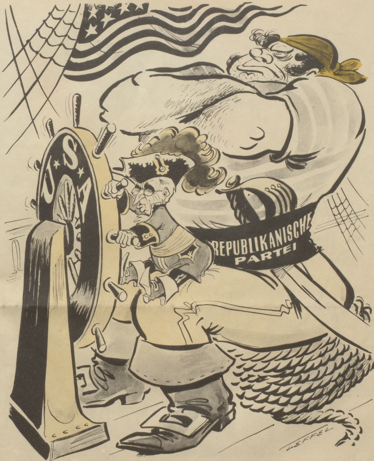
Präsident Truman, Lenker des Staatsschiffs!