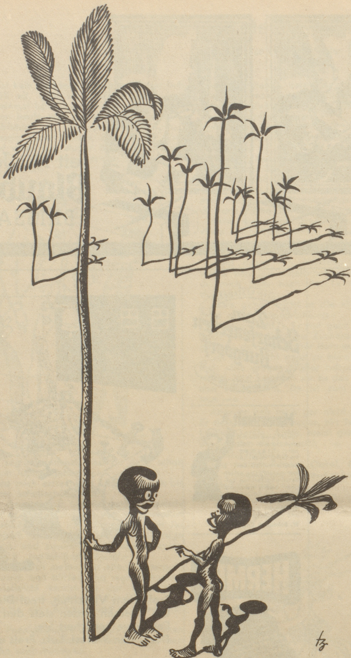
„Chumm mr mached Verbergis!“