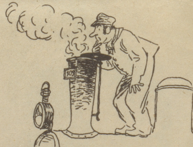
Aus „Dampfrosromantik am Gotthard“ von Paul Winter, illustriert von H. Laubi (Schweizer Spiegel Verlag Zürich)

Trotz gelobtem Schweigen ist diese Märe durchgesickert. Ein jeder hüte sich jedoch, ich rate es ihm, den Ferrari zu fragen: «Wie weit ist es von Faido nach Airolo?» O du mon Dieu!