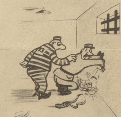
«Aberau Wärter! Wägeme Rüffel vom Tiräktler müenzi doch nüd durebränel»