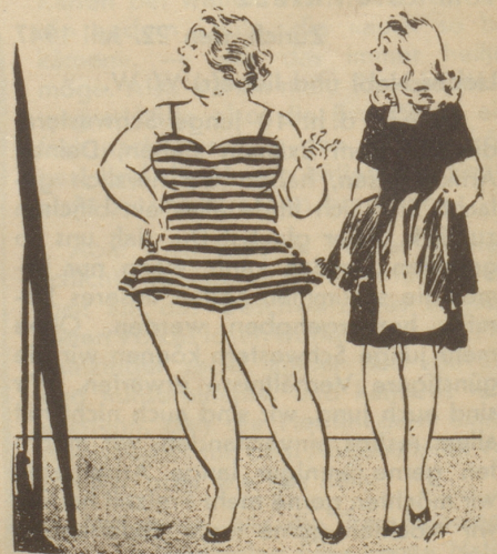
„Findet Sie nüd Schtreife mached dick?“ Tyrihans, Oslo

Eines war aber doch betrübend: während dieses Herumrennens hatte ich den anderen Schuh, den ich immer in Papier eingewickelt mit mir herumschleppte, irgendwo liegen lassen, — leider nicht im Tram! Wo sollte denn der gesucht werden... Nun, ich besitze wenigstens den ersten, habe ihn aufs Buffet gestellt, um ihn immer vor Augen zu haben, und sehe ich ihn an, so wird mir jedesmal leicht ums Herz: «Solch einen gut funktionierenden Apparat, wie das Tram-Fundbüro, gibt es sicher doch nur in unserem fortschrittlichen Sowjet-Land!» (übers. v. O. F.)