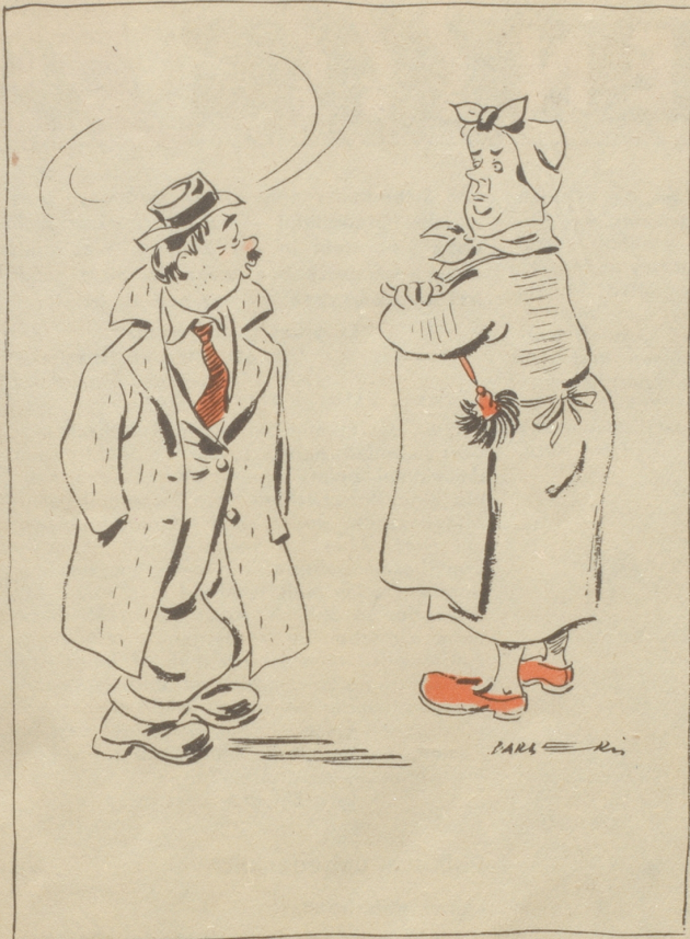
„Joseph?!“ „Hä weweisch doch Rörösli — Wasser schpare!“