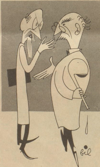
«Das war vorauszusehen: seit der Erfindung der Atome spricht kein Mensch mehr von meinen Molekülen!»