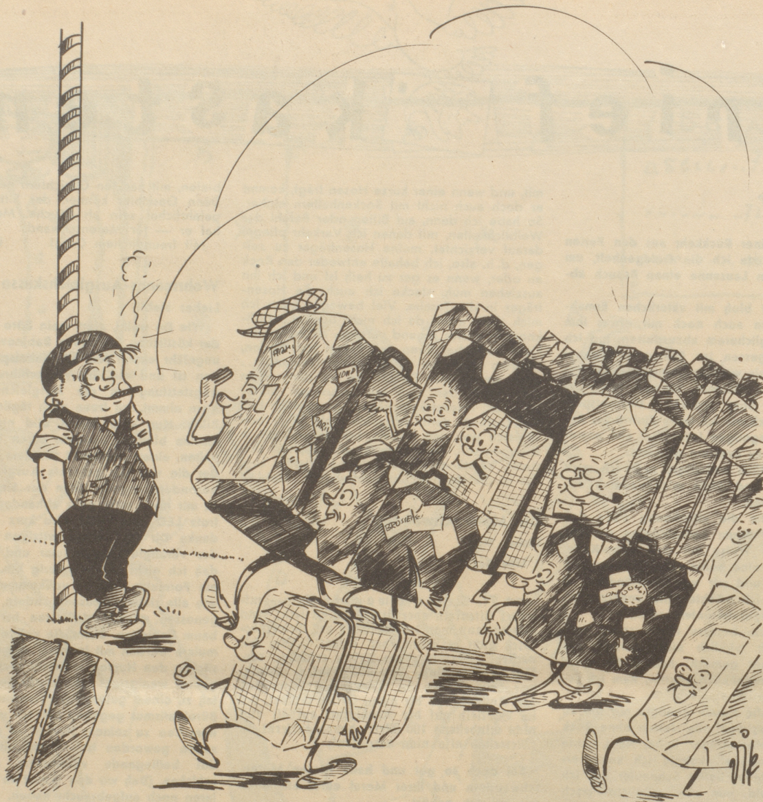
In Basel 165 000 Arrivées im Juli!

Des Chnaben Freude ischt nicht ungemischt, Weil für ihn selber fascht kein Platz mehr ischt!