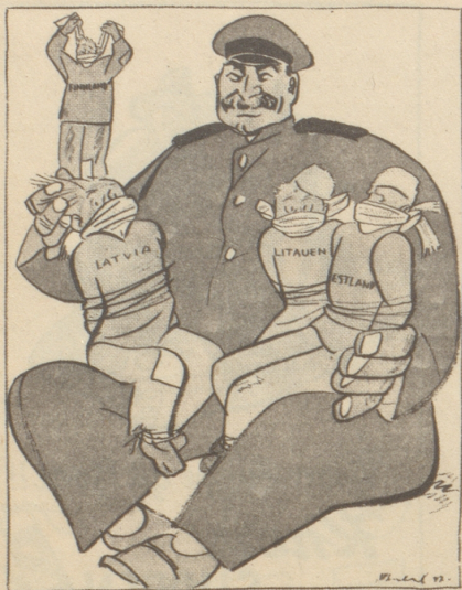
Unterdrückung der Randstaaten! Hat jemand klagen hören?