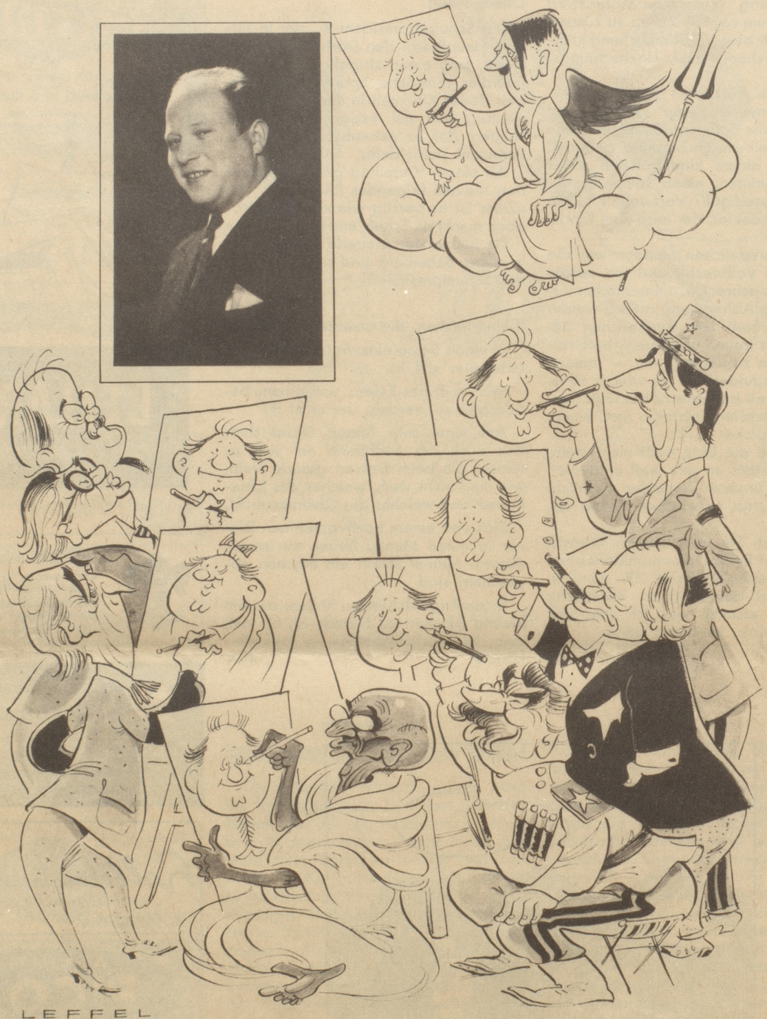
Zahn um Zahn — oder die Rache der Modelle