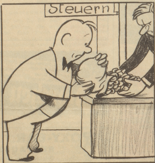
Die unfreiwilligen Abgaben