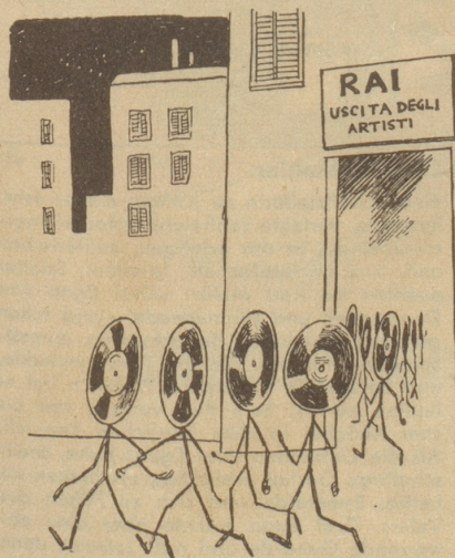
Der Ausgang für die «Künstler» am italienischen Radio.

Welch eine Freude ist es, ab und zu mit Landsleuten zusammenzutreffen! Dabei tauchen immer wieder, in hundertfachen Variationen, dieselben zwei Gesprächsthemen auf: allgemeine Verärgerung über die Militärpflichtersatzsteuer und großes Bedauern, daß schon seit fünfzehn Jahren keine «Grünen», keine jungen Schweizer Berufsleute und Landarbeiter, Melker und — Jodler, in die gutgeführten Schweizerkolonien und Schweizervereine nachströmen.