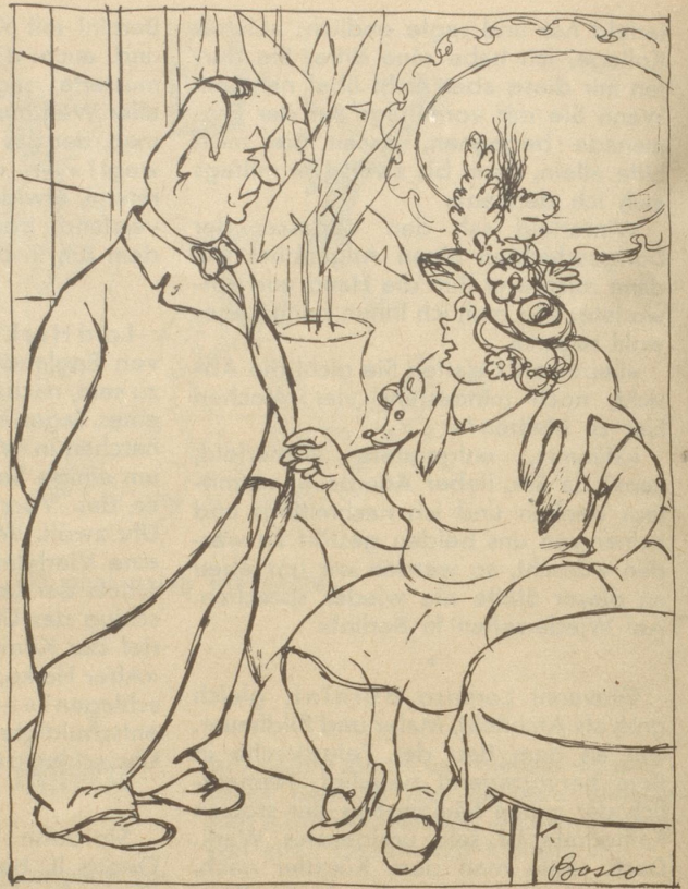
„Ihre Herr Brüeder sig schiints Mitglied vo dr P.d.A. worde?“ „Ja — aber wüssezi min Maa und ich lönd en jetzig links ligge!“