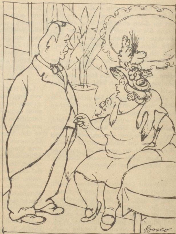
„Ihre Herr Brüeder sig schiints Mitglied vo dr P.d.A. worde?“ „Ja — aber wüssezi min Maa und ich lönd en jetzig links ligge!“