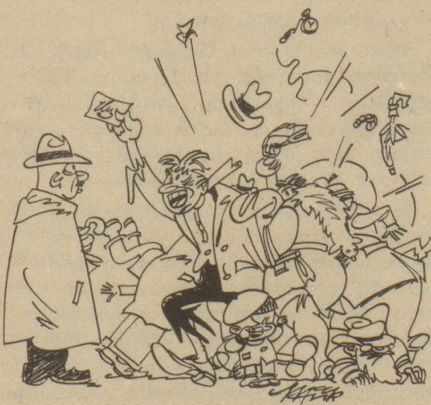
Filmhelden besuchen uns