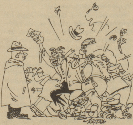
Filmhelden besuchen uns