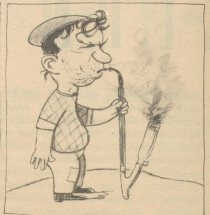
Dem Italiener ist der Tabak zu stark — er hätte ihn gerne milder gehabt.