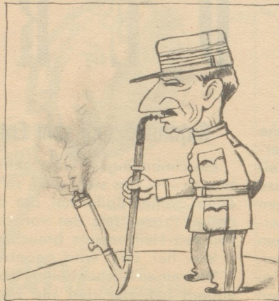
Dem Franzosen ist der Tabak zu leicht, er hätte gern mehr Ruhr-Tabak darin.