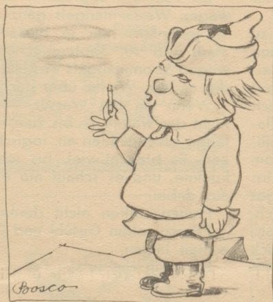
Der Russe zieht die rein russische Ziga- rette vor.