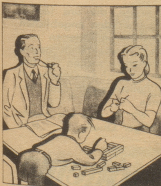
Hartmanns freuen sich seit kurzem draussen am eigenen Häuschen.