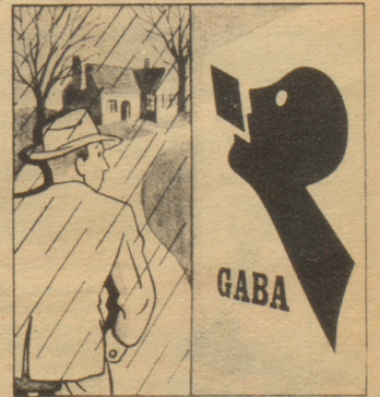
„Nimm Gaba, die schützen vor Husten und Heiserkeit. Gaba - ein guter Rat für Radfahrer.“