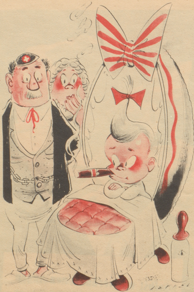
In einer westschweizerischen Zeitung spielt ein Milchproduzent mit der Drohung, die Kühe zu verkaufen und Tabak zu pflanzen.

Ein neuer Druck, den Preis zu lenken, Man darf nicht an die Folgen denken.