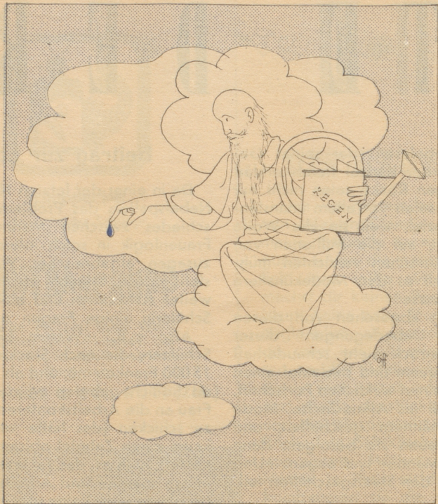
Der alte Petrus trätzelt!

Caran d'Ache Blei- & Farbstifte der Heimat