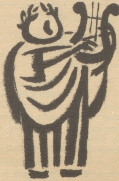
Die nächtliche Toga

Beachten Sie den großen UNIC-Wettbewerb der ELECTRAS BERN, Marktgasse 42