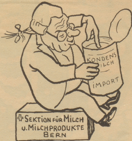
und DER seinen Finger