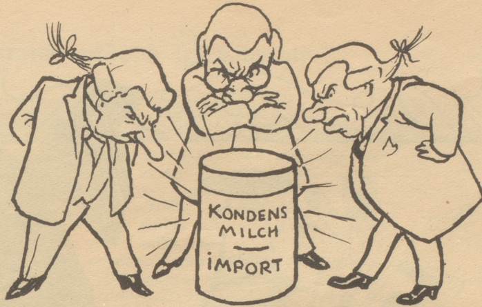
Aus Amerika kommt eine Büchse Kondensmilch bei uns an. Sie ist nicht teuer,