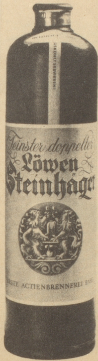
Erste Aktienbrennerei Basel