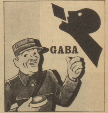
„Oh, ich habe immer eine Schachtel Gaba bei mir: Sie sollten auch Gaba im Haus haben, gerade in dieser Jahreszeit, denn Gaba beugt vor.“