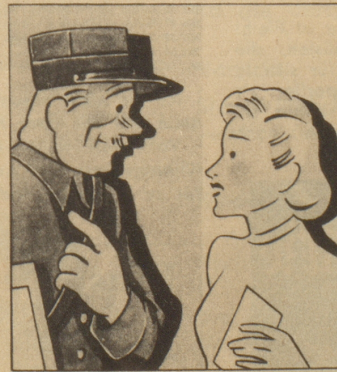
„Haben Sie nicht Angst vor Ansteckung?“ fragt sie, „Sie haben doch einen schweren Beruf.“