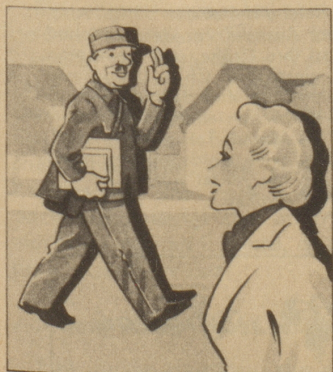
Der Briefträger ist gut Freund mit seinem ganzen Bezirk; er kennt alle und alle kennen ihn.

* „Capitol“, die gute, milde Orientcigarette von immer gleichbleibender Qualität. Ihres großen Umsatzes wegen ist sie außerordentlich günstig im Preis: 85 Cts. die 20 Stück!