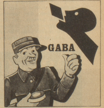
„Oh, ich habe immer eine Schachtel Gaba bei mir: Sie sollten auch Gaba im Haus haben, gerade in dieser Jahreszeit, denn Gaba beugt vor.“