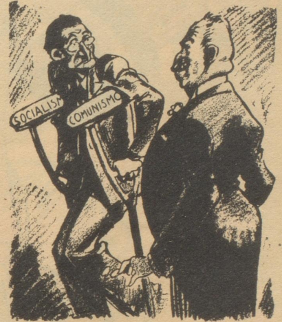
De Gasperi: «Und glauben Sie, Herr Doktor, daß ich mich auch ohne diese Krücken aufrecht halten kann?»