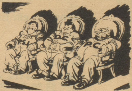
Von links nach rechts: Sozialisten, Christlich-Demokraten, Kommunisten.