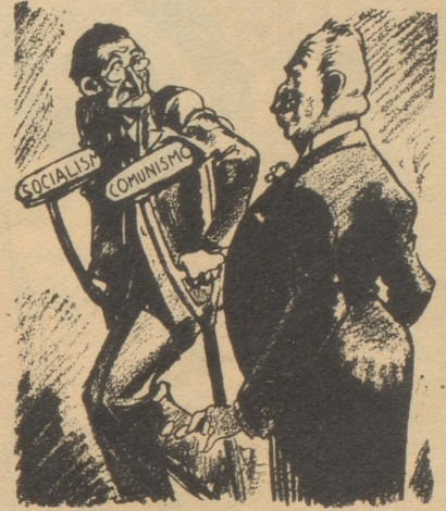
De Gasperi: «Und glauben Sie, Herr Doktor, daß ich mich auch ohne diese Krücken aufrecht halten kann?»