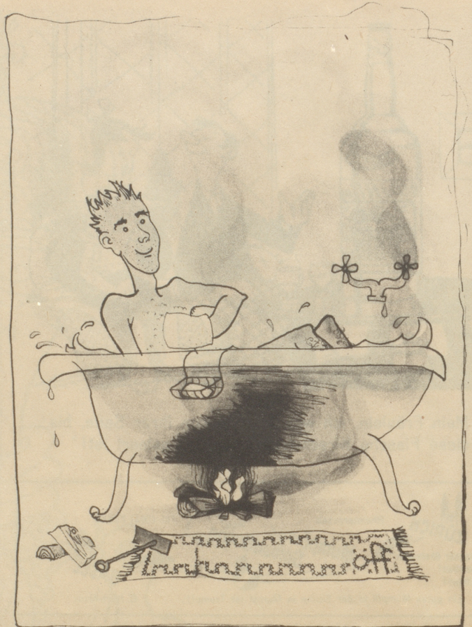
Brennholz frei — Boiler gesperrt!