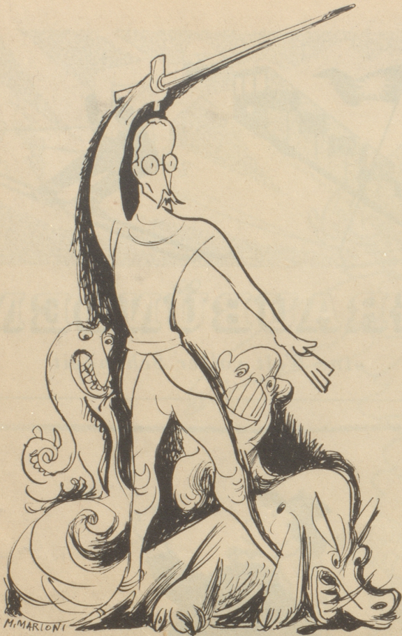
Blum im Heldenkampf gegen den Schwarzhandel